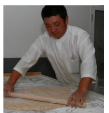
毎朝、その日製造分の餅を仕込むことで高品質の最中種製造に心がけています。